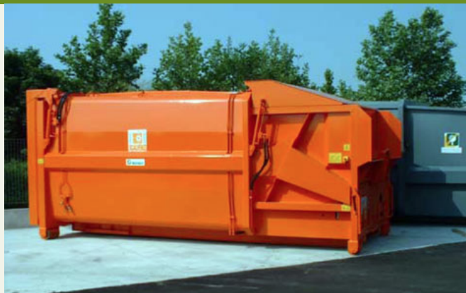
Motorizzazione elettrica standard da 11 Kw.