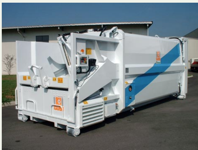
Motorizzazione diesel standard da 16 Kw.

Compattatore monopala con ampia bocca di carico, pala di compressione con movimento oscillante. Macchina robusta, compatta, assolutamente stagna con la guarnizione del portellone che arriva sino al tetto. Cilindri esterni non a contatto con i rifiuti, spinta normale alla resistenza di grande efficacia e carico che può arrivare anche oltre 10 tonnellate di RSU. Particolarmente adatto al travaso da satelliti.