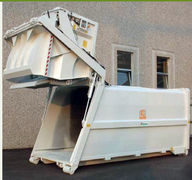
"CMS200 con camera di compressione ribaltata"

Compattatore monopala con le caratteristiche della bocca di carico analoghe al monopala CMS100, ma con struttura che prevede lo scarico anteriore con il sollevamento della bocca di carico e con espulsore a traslazione totale. S carica in orizzontale senza ribaltamento.