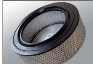
Filtro assoluto classe H efficienza 99,995% Filtro absoluto clase H efficiencia 99,995%