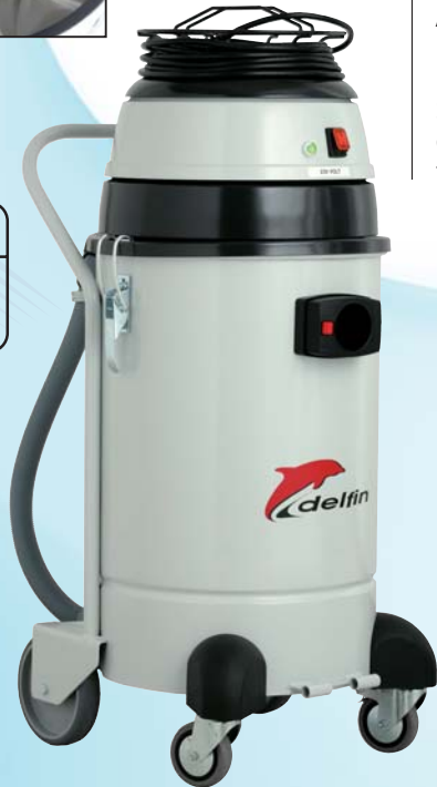
MISTRAL 501 WD