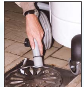
MISTRAL 802 WD