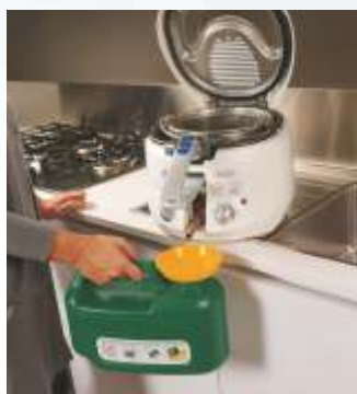
Filtra il tuo olio usato con gli accessori in dotazione