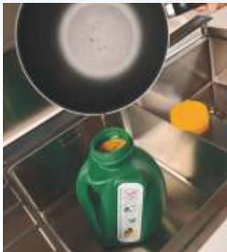
Filtra il tuo olio usato con la griglia in dotazione