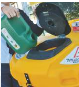
Portalo nelle apposite stazioni di raccolta autorizzate

Sede apposita per alloggiamento imbuto (brevettata)