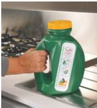
E' facilmente trasportabile