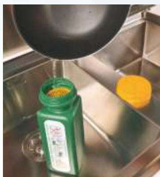
Filtra e recupera con la griglia in dotazione