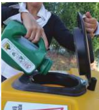
Portalo nelle apposite stazioni di raccolta autorizzate