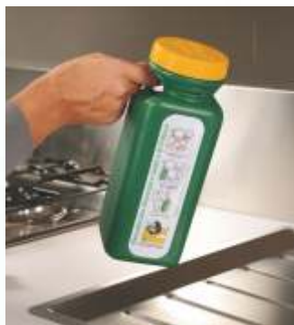
E' facilmente trasportabile