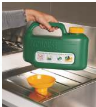
E' facilmente trasportabile