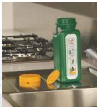
Pratica e poco ingombrante